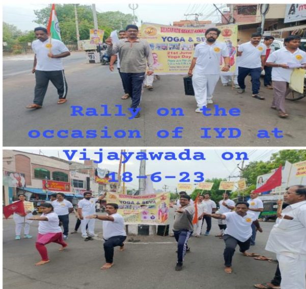
On 18-06-2023 Department of Physical education organized a rally to aware the people on the eve of International yoga day in Vijayawada.